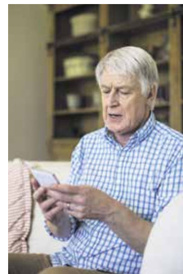
Die App gibt es für alle gängigen Smartphones.

Der Download der App (QR-Code für Google Play unten links) lohnt sich. Sie ist im App Store und bei Google Play unter dem Namen „SoVD Magazin“ zu finden. Nutzerinnen und Nutzer mit mobilen Geräten werden außerdem per Push-Nachricht sofort über neue Ausgaben und Artikel informiert.