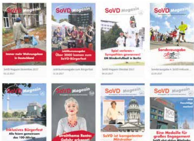
Oben der Link, wie er auf www.sovd.de steht, die untere Reihe zeigt den Kiosk mit allen verfügbaren Ausgaben.