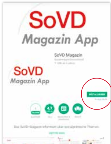
Dann die App auswählen und auf „Installieren“ klicken.