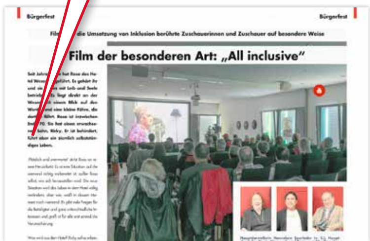
Das rote Widget mit dem Youtube-Logo zeigt an, dass sich dahinter ein Video zum Thema verbirgt.

Ein Klick auf das Icon „Sprechblase“ aktiviert den Vorlesemodus.