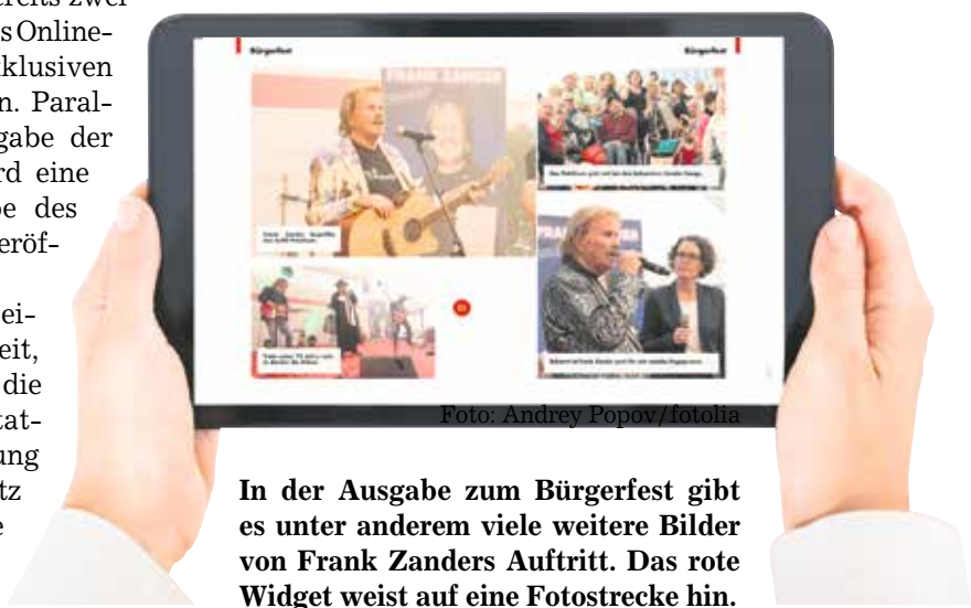
In der Ausgabe zum Bürgerfest gibt es unter anderem viele weitere Bilder von Frank Zanders Auftritt. Das rote Widget weist auf eine Fotostrecke hin.

Ein Tippen auf den Text aktiviert den Textmodus. Dieser eignet sich dazu, längere Stücke ganz bequem ohne Blättern und Scrollen zu lesen. In diesem Modus ist in der App auf mobilen Geräten eine Funktion enthalten, die die Texte auf Wunsch vorliest. Es gibt bereits mehrere Tausend Nutzerinnen und Nutzer der Anwendung. Überzeugen auch Sie sich von den Vorteilen der SoVD-Magazin-App!