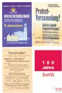
Ein Postkarten-Block gratis.