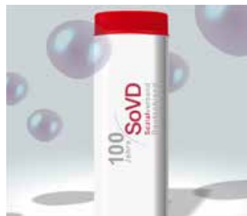
Seifenblasen mit SoVD-Logo.