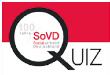
Das SoVD-Quiz kann in Gruppen gespielt werden. Bestellungen sind kostenfrei.

Knapp drei Monate vor dem großen Festakt zum 100-jährigen Bestehen am 23. Mai und vor den darauffolgenden Festwochen laufen die Vorbereitungen in allen SoVD-Landesverbänden auf Hochtouren. Auch im SoVD-Bundesverband werden mit großem Eifer die Festakte und Veranstaltungstermine vorbereitet.