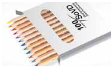
Buntstifte zum Bestellen.

Über sozialpolitische Initiativen informiert „SoVD aktiv“. Ergänzt wird SoVD aktiv durch ein entsprechendes Portal auf www.sovd.de unter „Informieren“. Adressaten sind die Vorsitzenden der SoVD-Kreise und Bezirke. Die Eingabe des Nachnamens (Benutzer) und der Organisationsnummer (Passwort) ermöglicht den Zugang. Über die Plattform werden u. a. verschiedene Materialien wie Mustertexte bereitgestellt, die motivieren und bei Aktivitäten in den Gliederungen unterstützen sollen.