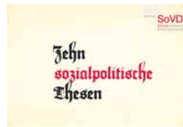
Bestellbar: ein DIN-A3-Block mit zehn sozialpolitischen Thesen zum „Anheften“.