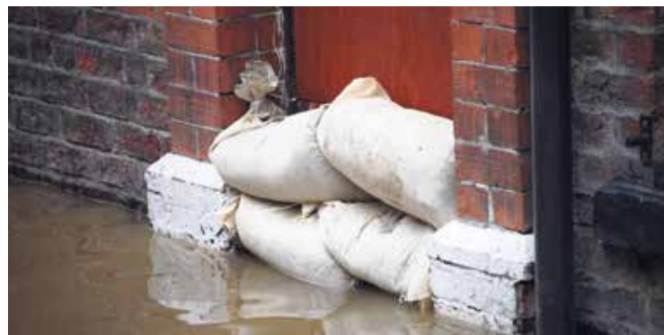
Diese Säcke vor der Tür schützen zusätzlich vor Feuchtigkeit.

Gerade in früheren Zeiten wussten die Menschen eine warme Stube zu schätzen. Um sich vor unnötiger Zugluft zu schützen, befestigte man damals leere Säcke im Türrahmen. Durch das schwere Sackleinen konnte man hindurchgehen, ohne dass zu viel Wärme aus dem Inneren der Wohnung entwich. Lässt jemand eine Tür hinter sich offen, wird er somit auch heute noch gefragt: „Haben wir etwa Säcke vor der Tür?“