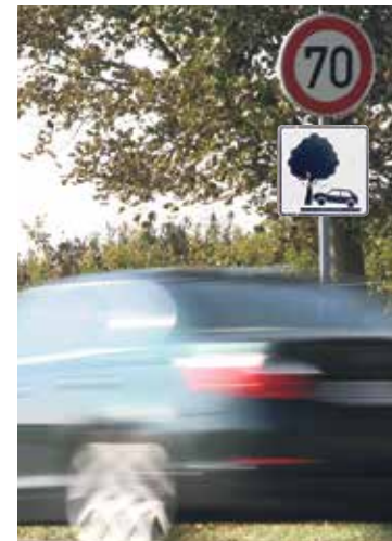
Darf man hier höchstens mit 70 km/h gegen Bäume fahren?

Die Sache ging vor das Oberlandesgericht Oldenburg, wo der renitente Raser unterlag. Die Richter beurteilten das Tempolimit als wirksam. Die Interpretation des Klägers komme nicht ernsthaft in Betracht. Niemand käme auf die Idee, das Limit gelte nur dann, wenn mitten auf der Fahrbahn ein Baum stehe. Auch eine Auslegung, wonach man höchstens mit 70 km/h gegen einen Baum fahren dürfe, sei abwegig.