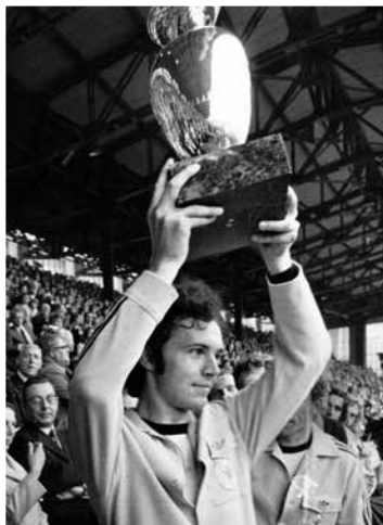
Franz Beckenbauer wurde 1972 Europameister.

War der Ball im Londoner Wembley-Stadium nun hinter der Linie oder nicht? Durch eine umstrittene Entscheidung des Schiedsrichters wird England 1966 Fußball-Weltmeister. Dieses „Wembley-Tor“ geht in die Geschichte ein.